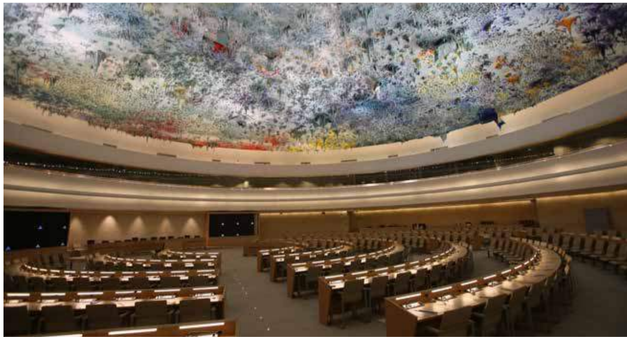
Sitzungssaal des Menschenrechtsrates der Vereinten Nationen.

gegenseitigen Respekt stützt. Die Besessenheit des UNHRC, Israel zu kritisieren, muss aufgegeben werden.