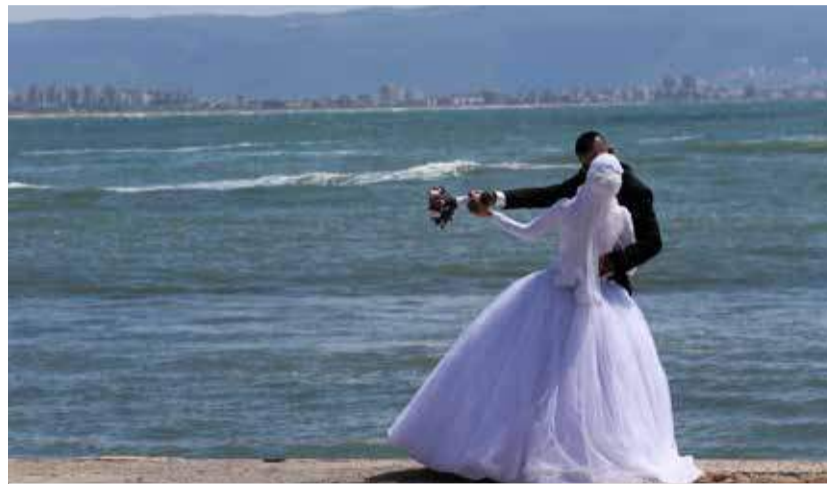
Eine Heirat im Ausland könnte Paaren mit unterschiedlicher Religionszugehörigkeit künftig erspart bleiben. (Bild: Brautpaar in Akko)

Ein Beispiel sind die etwa eine Million Bürger, die nach dem Fall der Sowjetunion nach Israel einwander-