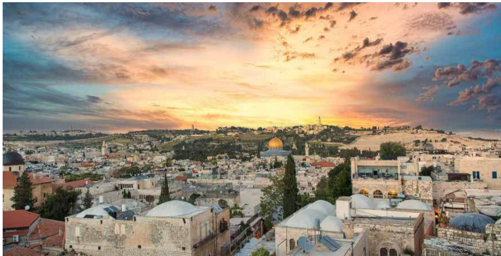
Von Jerusalem aus wird der Messias Jesus über ein weltweites Friedensreich regieren.

Mit dieser gesamtbiblischen Heilsperspektive gewinnen wir zunächst einen geschärften und vertieften Blick auf das jüdische Volk, auf Israel und auf Jerusalem im Licht ihrer Berufung.