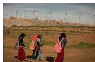
Größte Müllhalde Israels: Dudaim-Deponie nahe der Beduinestadt Rahat.