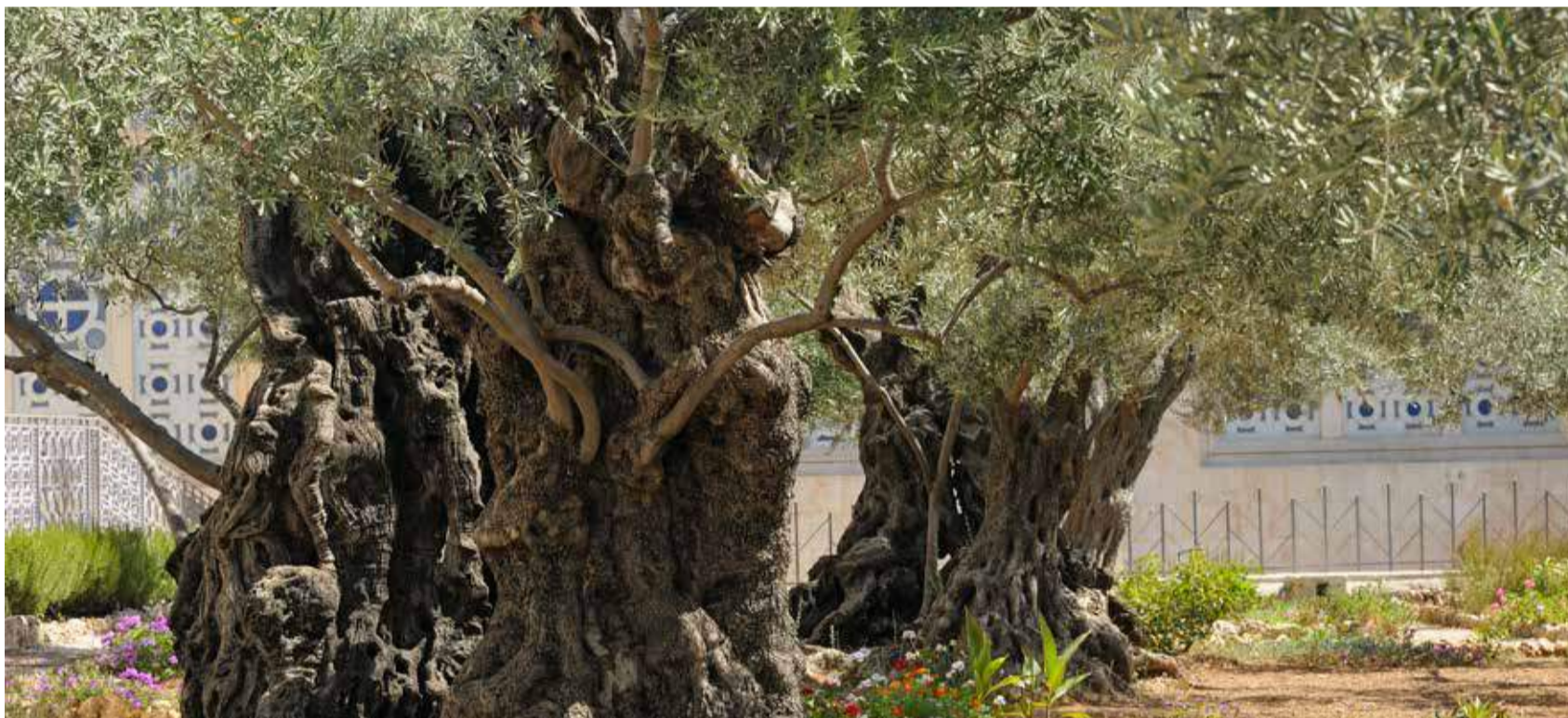
Der Anblick der uralten Olivenbäume im Jerusalemer Garten Gethsemane dient Christen zur Erinnerung daran, dass sie als Zweige in den Stamm Israels eingepropft sind.

Was bedeuten dir diese Identität, Zugehörigkeit, Bestimmung und Hoffnung die aus der Aussage Jesu „das Heil kommt aus den Juden“ für dein Leben erwachsen? Hast du sie dir schon zu eigen gemacht? Welche Handlungsimpulse leitest du für dich daraus ab? Ich möchte dich einladen, mit Saulus zusammen zu fragen: „Herr, was willst du, das ich tun soll?“ Apg 9,6 |