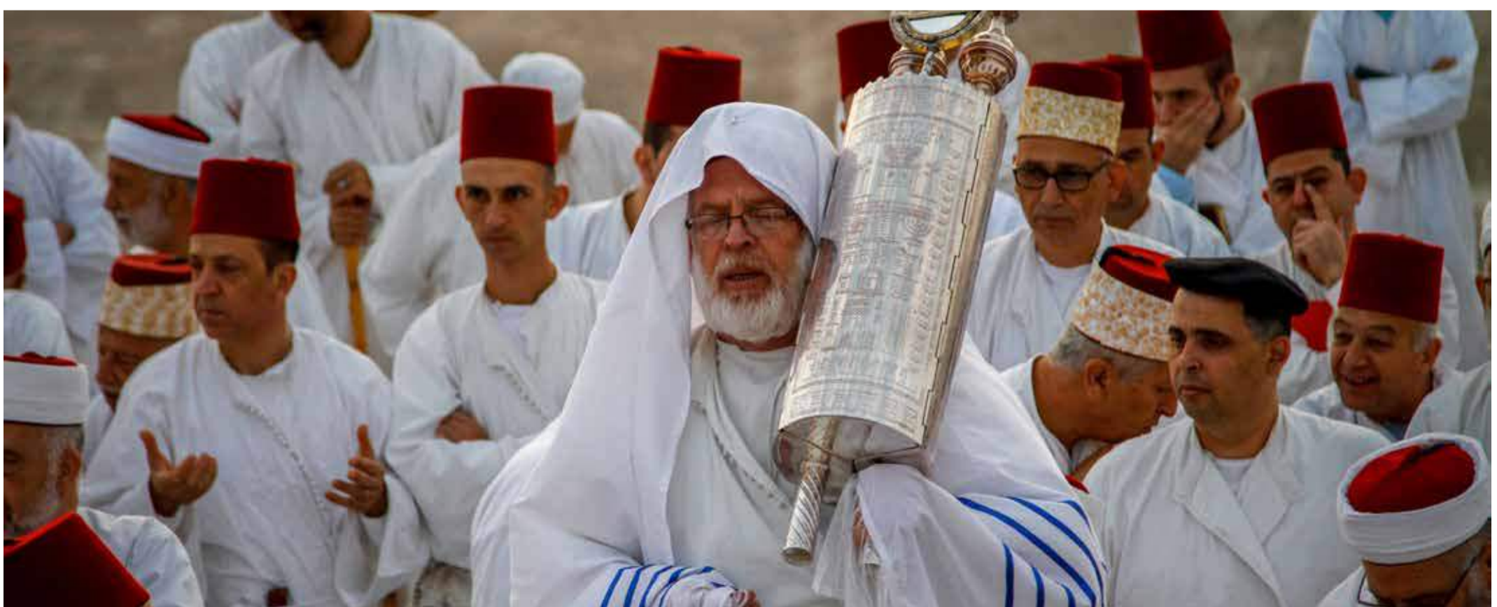
In Israel leben heute noch rund 700 Samaritaner. Sie pflegen die Traditionen des alten Israel und leben nach den fünf Büchern Mose. Andere Schriften der Hebräischen Bibel erkennen sie nicht an. Jedes Jahr pilgern sie zum Berg Gareztim bei Nablus, dem biblischen Sichem, in Samaria. Der „Segensberg“ ist für sie die heiligste Stätte.