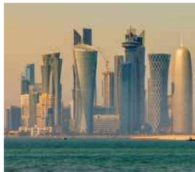
Islamistisch oder fortschrittlich? Katar scheint zwiespalten.

Katarische Kinder sind in ihren Unterrichtsmaterialien konstant mit der Dämonisierung Israels und „Ungläubiger“, also der Nicht-Muslime, konfrontiert. Sie lernen, die arabisch-israelische Normalisierung kategorisch abzulehnen. Gewalttätige Interpretationen des islamischen Dschihad-Begriffes sind allgegenwärtig. Antisemitische Aussagen stehen teils auf religiöser, teils rassistischer, teils israelfeindlicher Basis. Ein Blick auf die Schulbücher, wie sie aktuell in