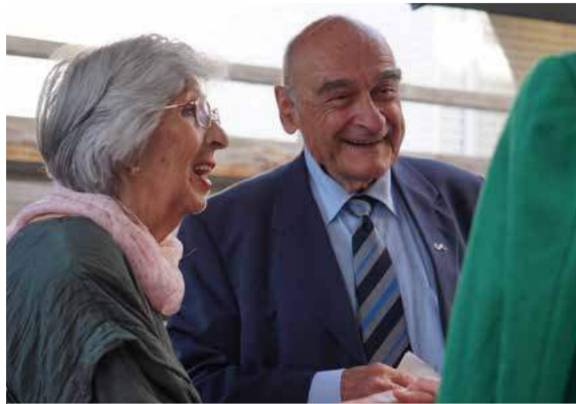
... zu Herzensangelegenheiten.