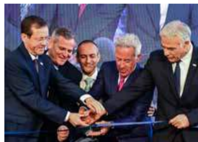
Eröffnung mit Staatspräsident Jitzchak Herzog (l.), Premier Jair Lapid (r.) und Spender Sylvan Adams (2.v.l.).

den Verletzungen haben, beim Betreten der Aufnahme einer Selbstuntersuchung durch einen Roboter unterziehen. Ein automatisiertes System misst neben der Körpertemperatur auch den Blutdruck, den Puls