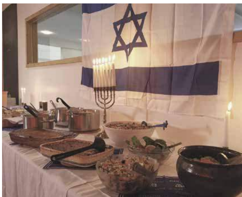
Ein Buffet aus israelischen Köstlichkeiten gehört zu einer Schabbat-Feier dazu.

Mehr Informationen über die Arbeit von ReformaZION gibt es unter www.reformazion.com