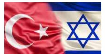
Die Jahre des Streits scheinen vorbei.

die Hamas operieren. Und Erdoğan stichelte immer wieder gegen Israel, etwa mit der Behauptung, es sei der „rassistischste Staat der Welt“. Noch