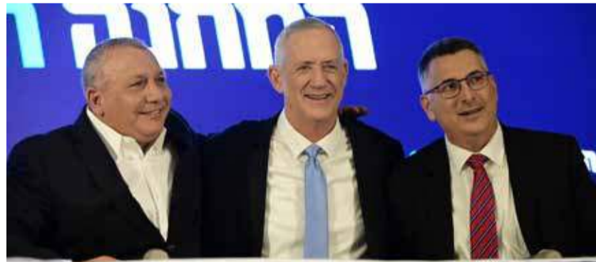
Gadi Eisenkot, Benny Gantz und Gideon Sa'ar (v.l.n.r.) bei einer gemeinsamen Pressekonferenz.

nen, denn die Fusion mit Eisenkot war für das neue Polittrio gleichzeitig Anlass, sich einen neuen Namen zu verpassen. „HaMachane HaMamlachiti“ nennt sich das Bündnis nun, dazu