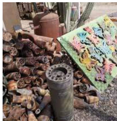
Aus den Überresten von Raketen ...