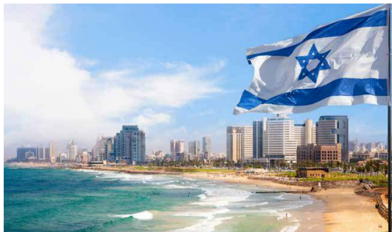
Israel blüht – wo einst Sand und Wüsten waren, sind Städte entstanden. Im Bild: Tel Aviv.

Buchempfehlung: „Zeiten der Wiederherstellung“ (Seite 7)