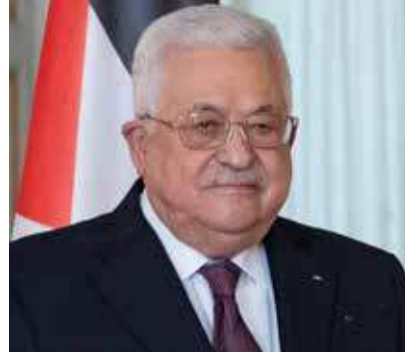
Nicht zum ersten Mal hat Abbas den Holocaust relativiert.

ter in Berlin, Ron Prosor, sagte laut einer Mitteilung der Botschaft, Abbas' Äußerung erinnere an dessen Doktorarbeit „in der er den Holocaust unverblümt leugnete. Sie steht auch im Einklang mit der anhaltenden bösartigen Hetzkampagne gegen