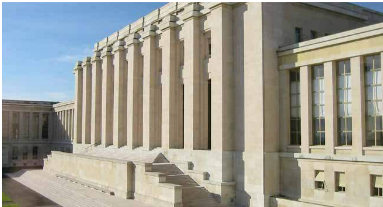
Hauptsitz der Vereinten Nationen in Genf.