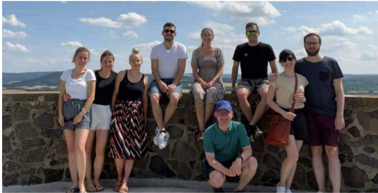
IC-Kernteam-Ausflug zur Burg Hohenburg in Homberg (Efze) bei schönstem Juli-Wetter.

Lore und Luisa: „Kürzlich sind wir auf das Reiseangebot im September aufmerksam geworden und wir sind beeindruckt von der Community und Vernetzung von jungen Leuten, die ein Herz für Gottes Geschichte mit Israel haben. Schon seit längerem haben wir den Wunsch, nach Israel zu reisen, Land und Kultur kennenzulernen, um Zusammenhänge aus Gottes Wort und seine Intention mit seinem auserwählten Volk besser zu verstehen.“ |