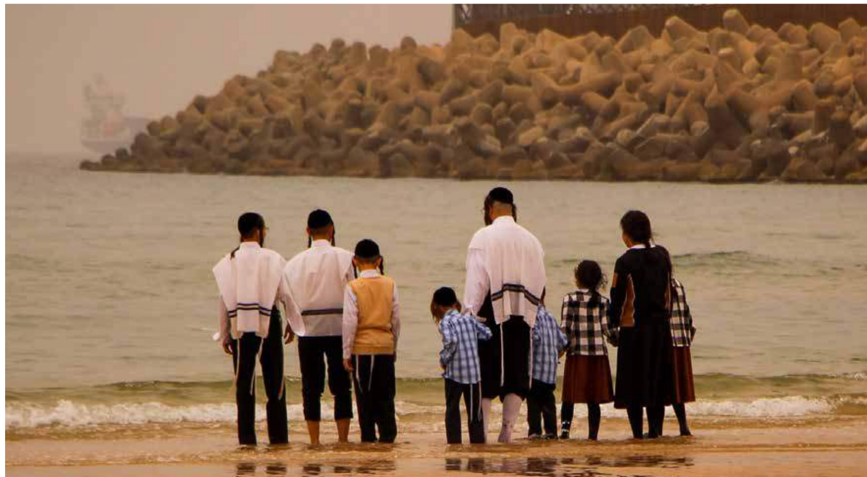
Religiöse Juden versuchen, so treu wie möglich nach der Tora zu leben.

Israels Rettung hat schon begonnen. Es gibt bereits Christen, die Juden mit aufrichtiger Liebe und Wertschätzung begegnen, dass diese aufhören und ins Nachdenken kommen: Ist an Jesus vielleicht doch was dran? Der endgültige Durchbruch wird aber wohl erst kommen, wenn Jesus wiederkommt. Dabei wird sich ein wichtiger Unterschied zeigen: Zu den Völkern kommt Jesus als Richter, zu Israel aber kommt er als Messias, als Retter seines Volkes (vgl. Sacharja 12; Matthäus 23,37-39; 24,27-32).