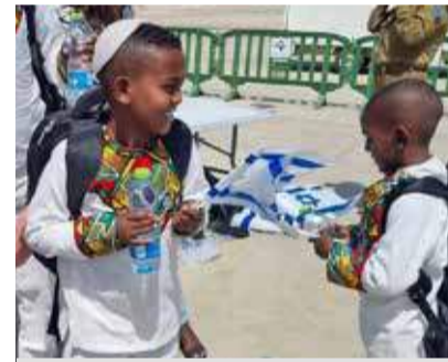
CSI konnte dank Spenden die Einwanderung von Juden aus Äthiopien unterstützen.

auf einen Weg der Erlösung führen möge.“ Mor weist darauf hin, dass die gemeinsame Arbeit von Herausforderungen und Ungewissheit geprägt sei. Dabei begegne man oft der Angst. „Aber wir müssen uns daran erinnern, dass wir keine Angst haben