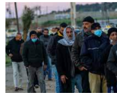
Palästinensische Arbeiter am Eres-Grenzübergang auf dem Weg nach Israel.