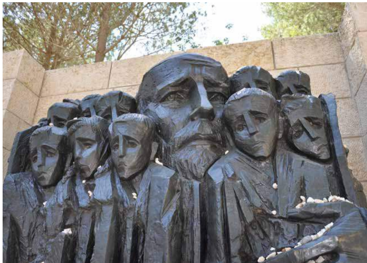
Die Skulptur „Korczak und die Ghetto-Kinder“ des Bildhauers Boris Saksier in der Jerusalemer Gedenkstätte Yad Vashem symbolisiert das Leiden des jüdischen Volkes während des Holocaust.

Gott ist in diesem Sinne des Wortes immer „nahe“, wie David es in Psalm 139,7-12 so schön ausdrückt. Man sollte diesen Psalm nicht in eine theologische Lehre über die „Allgegenwart“ Gottes verwandeln. Das ist darin enthalten, aber David ist auch an anderen Stellen besorgt darüber, dass Gott „weit weg“ ist (Psalm 10:1; 22:2, 12, 20; 35:22; 38:22; 71:12). Die Tatsache, dass Gott manchmal im Feuer, Sturm oder Donner bei Seinem Volk ist, bedeutet nicht, dass Er eine Art heidnischer Feuer-, Sturm- oder Donnergott ist (vgl. Psalm 29). Schließlich ist er manchmal nicht im Feuer oder im stürmischen Wind, sondern „im Ton eines sanften Säusels“ zugegen. (1. Könige 19,11-12). Aber das ändert nichts an der Tatsache, dass Gott immer bei Seinem Volk ist, unter allen Umständen. Welch ein Trost! |