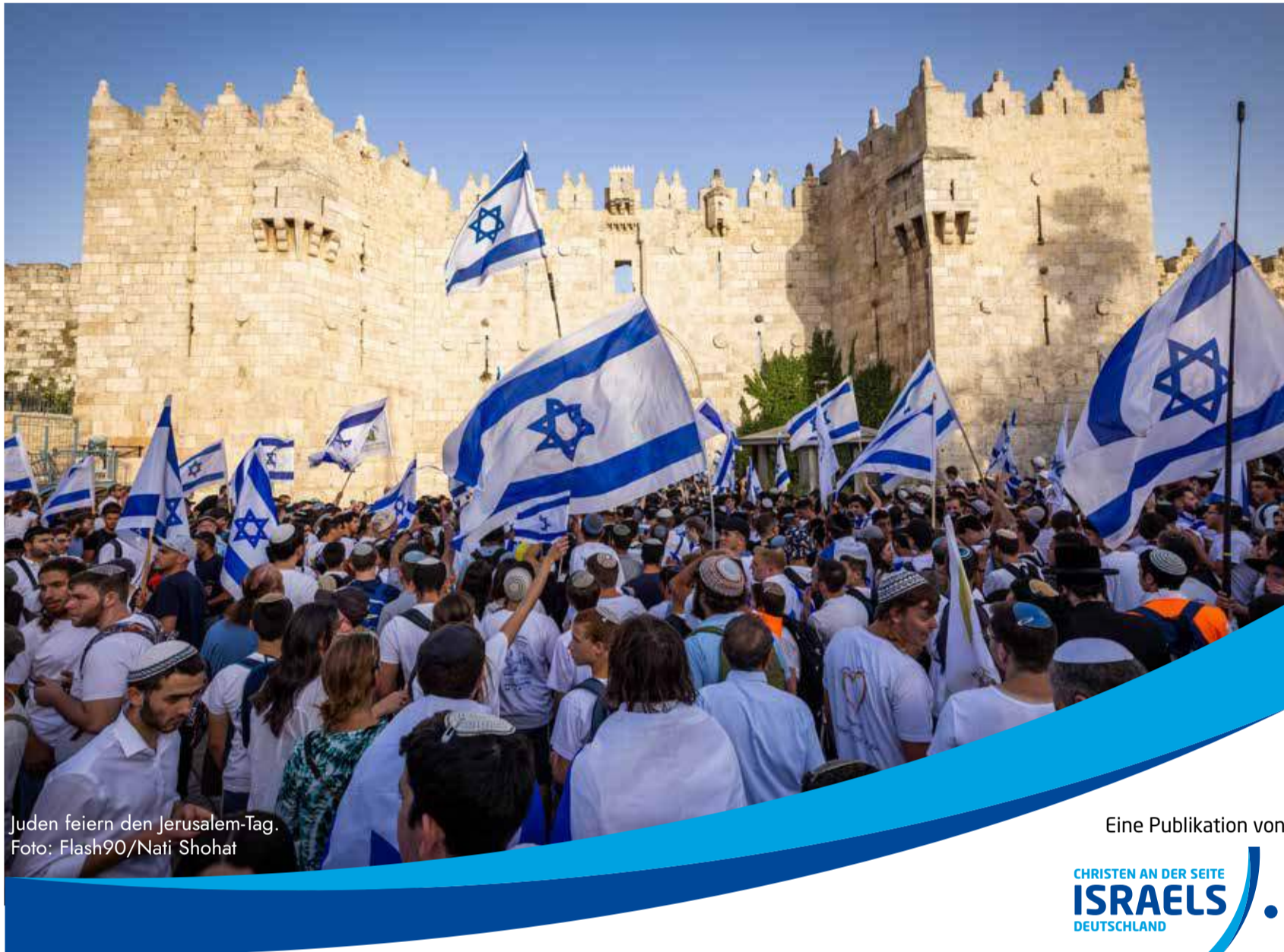
Juden feiern den Jerusalem-Tag.