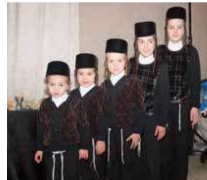
Einige von Shays Neffen.

Das kommt, weil wir in der Schule Jiddisch gesprochen haben. Aber jetzt lerne ich Deutsch, das brauche ich für meinen Master. Manchmal ist es verwirrend, es gibt viele Unterschiede zwischen Deutsch und Jiddisch. Aber ich mag Sprachen generell.