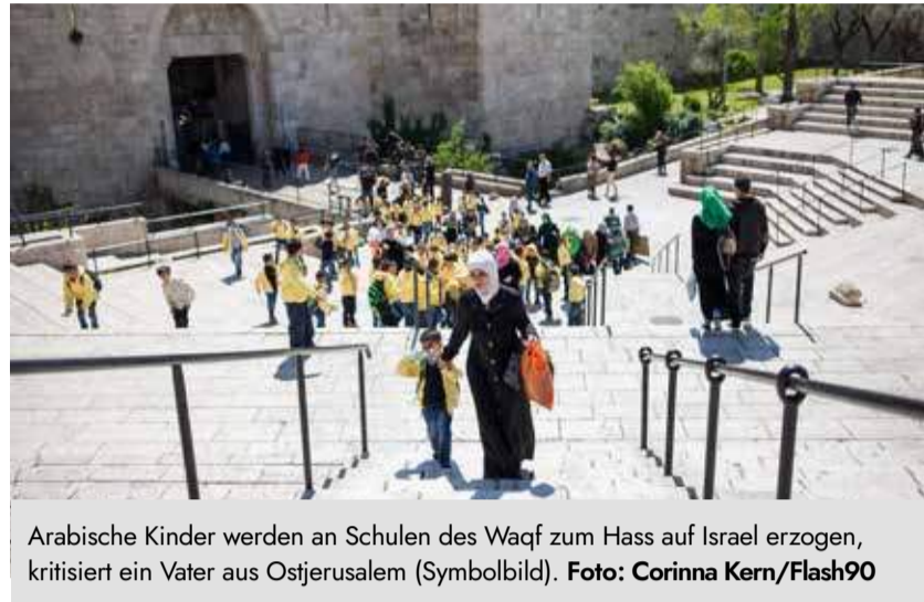
Arabische Kinder werden an Schulen des Waqf zum Hass auf Israel erzogen, kritisiert ein Vater aus Ostjerusalem (Symbolbild).

freien?“ Ich fragte ihn, wie er darauf käme und er sagte, dass sie in der