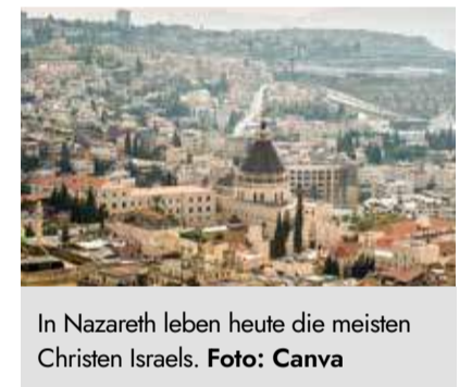
In Nazareth leben heute die meisten Christen Israels.