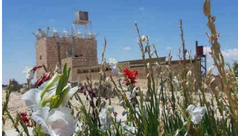
Blühende Gladiolenbeete in Mitzpe Revivim.

1937 legte die Peel-Kommission ein Empfehlungsschreiben für eine Zwei-Staaten-Lösung vor. Dabei war ein