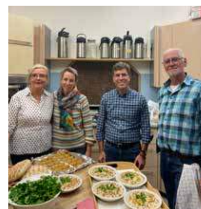
Der Israelkreis der Gemeinde hat verschiedene israelische Köstlichkeiten vorbereitet.

Vielen Dank an dieser Stelle für alle Gebete und alle finanzielle Unter-