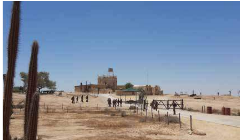
Historische Anlagen in Mitzpe Revivim mit einem Modell, das die ausgefeilte Bewässerungsanlage zeigt.

1947, kurz vor der UN-Abstimmung, die den Weg für die Staatsgründung ebnete, besuchte eine UNESCO-Delegation Revivim. Auf einer Infotafel des Freiluft-Museums wird Folgendes