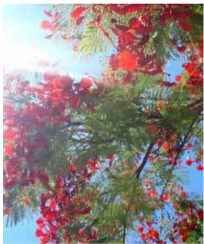
Blühende Bäume am Rande der Negev-Wüste dank eines ausgeklügelten Bewässerungssystems.

So faszinierend wie die Wüste selbst ist die Geschichte der Visionäre, die sie blühen sehen wollten.