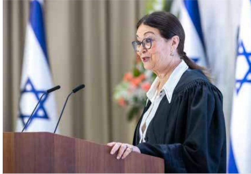
Die Präsidentin des Obersten Gerichts, Esther Hayut, will zurücktreten, wenn die Justizreform wie geplant umgesetzt werden sollte.

dung zunächst vertraglich verpflichtet, die Erarbeitung und Verabschiedung einer Verfassung innerhalb eines Jahres zu erledigen, dann aber den selbst gesetzten Termin platzen lassen. Sie fanden damals schlicht keine gemeinsame Lösung. Zu unterschiedlich waren die Ansichten im Gefüge zwischen sozialistisch geprägten, atheistischen Juden und etwa den Ultra-Ortho-