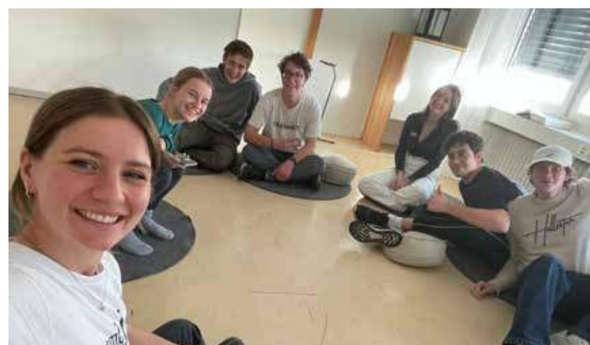
Bibelarbeit in kleinen Gruppen.

Mit einem Verkleidungswettbewerb forderten wir die Truppe heraus, sich vorzustellen wie Jesus am ehesten ausgesehen haben könnte. Wir zeigten ihnen anschließend die Stellen in der Tora, die die Zizit (Quasten), sowie den Tallit (Gebetsschal) beschreiben, den Jesus so wie alle männlichen Juden laut dem Gesetz