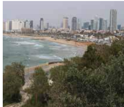
Im Mittelmeer, hier vor Tel Aviv, sind Tsunamis möglich.