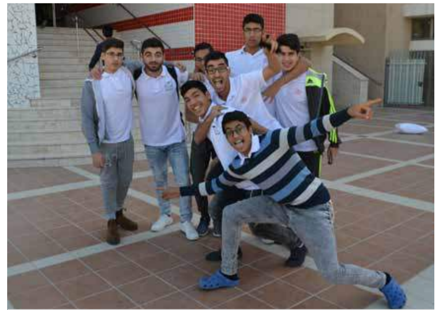
Jungen aus schwierigen familiären Verhältnissen erhalten an der Internatsschule des Jaffa Instituts in Bet Shemesh die Chance auf eine bessere Zukunft.

wird mit zahlreichen Kursen ergänzt, die auf die jeweiligen Stärken der Jugendlichen ausgerichtet sind. So gibt es die Möglichkeit, Berufskurse für Tischlerei oder Robotik zu besuchen, oder sich bei verschiedenen Freiwilligenarbeiten einzubringen. Derzeit sucht das BSEC Unterstützung für die Einrichtung eines neuen hochmodernen Autotech-Programmes. Die Kfz-Werkstätten und Unterrichtsräume sollen mit Diagnose- und Programmiergeräten ausgestattet werden. Dies soll sowohl die Entwicklung als auch die Reparatur von elektronischen Komponenten ermöglichen, die in autonomen und mit alternativen Kraftstoffen betriebenen Fahrzeugen eingesetzt werden.