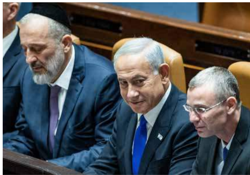
Der frühere Minister für Inneres und Gesundheit, Deri (l.), mit Premier Netanjahu (Mitte) und Justizminister Levin (r.).

gemeinsam Verfassungsrechtlichkeit auszutarieren hätten. Vor allem, wenn durch die Novellierung des Nominationsverfahrens Meinungsvielfalt auf den Richtersthühlen des Obersten Gerichts möglich würde und somit Einstimmigkeit auch dort nur durch Diskurs und Kompromisse zu erreichen wäre. Solch ein System birgt das Potenzial, das momentane Gegenüber der Gewalten in ein Miteinander zu verwandeln. Die israelische Demokratie hat an der Stelle gerade eine Suppe auszulöffeln, die ihr die Gründergeneration eingebracht hat. Denn die Gründerväter hatten sich in der Staatsgrün-