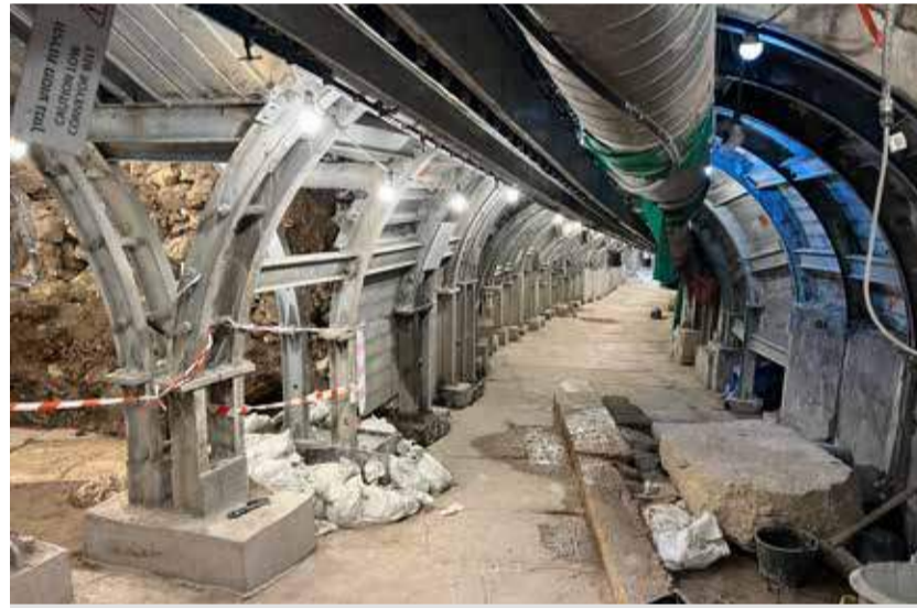
Bei den unterirdischen Ausgrabungen müssen die Archäologen sehr sensibel vorgehen und können sich nur in ganz kleinen Schritten vorarbeiten. Der Tunnel wird durch ein Stahlkonstrukt gestützt, um das darüberliegende Wohnviertel nicht zu gefährden. Finanziert werden die Ausgrabungen von der israelischen Regierung und privaten Spendern.