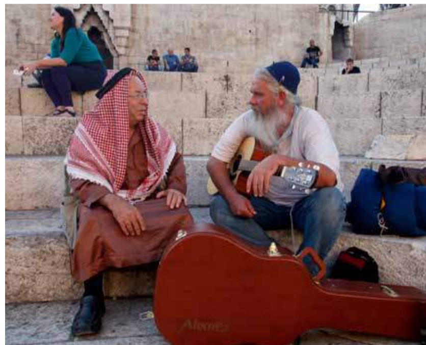
Laut Meinungsforschern scheint Frieden zwischen Arabern und Juden in der Region weiter entfernt denn je (Symbolbild).

Staat sprachen sich 23 Prozent der Palästinenser, 20 Prozent der jüdischen Israelis und 44 Prozent der israelischen Araber aus. Für einen Staat unter israelischer Herrschaft ohne Gleichheit für Palästinenser stimmten 37 Prozent der jüdischen Israelis. Ein palästinensischer Staat ohne Gleichheit für Juden könnte 30 Prozent der Palästinenser und 20 Prozent der Araber gefallen.