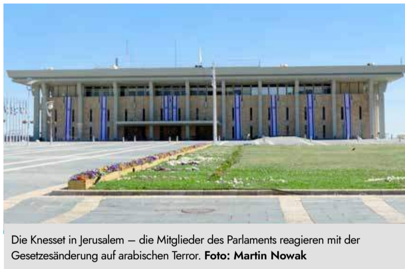
Die Knesset in Jerusalem – die Mitglieder des Parlaments reagieren mit der Gesetzesänderung auf arabischen Terror.

muss laut dem Gesetz bei einem Gericht vom Innenminister in Übereinstimmung mit dem Justizminister beantragt werden. Eine permanente Aufenthaltserlaubnis, wie sie etwa Palästinenser in Ostjerusalem meist haben, soll der Innenminister direkt