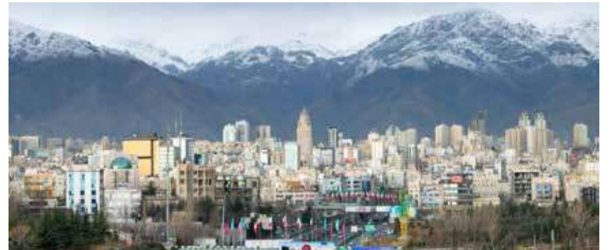
Das Regime in Teheran hat weitere Organisationen und Einzelpersonen aus Europa auf seine Sanktionsliste gesetzt (Bild: Teheran).

Wer auf der Sanktionsliste des Iran steht, darf nicht mehr in die Islamische Republik einreisen oder sich mit offiziellen iranischen Vertretern treffen. Zudem werden Vermögenswerte und Konten der Betroffenen im iranischen Hoheitsgebiet gesperrt.