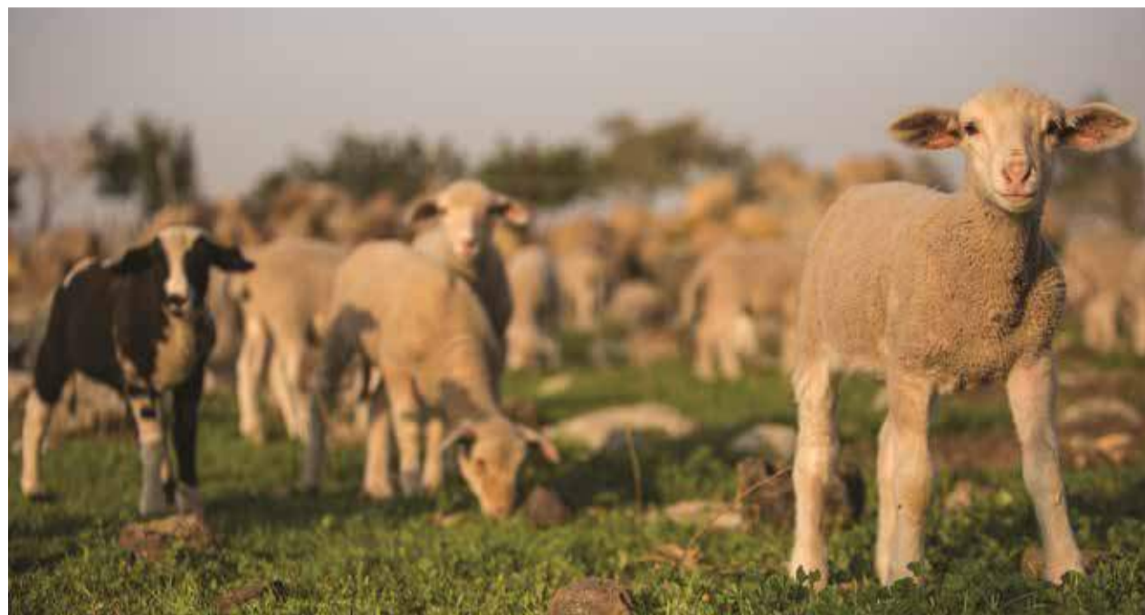
Lämmer waren im Altertum beliebte Tiere für religiöse Opfer.

In der jüdischen Tradition wird von einem Passahwunder erzählt: Die Ägypter waren wütend als sie hörten, dass die Israeliten Lämmer (ihre Götter) in ihre Häuser brachten und sie an ein Tischbein banden, um sie zu schlachten. Aber sie konnten nichts dagegen