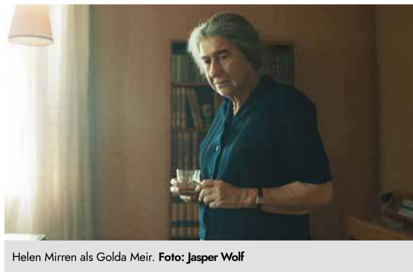
Helen Mirren als Golda Meir.

ren. „Sie war unglaublich mutig“, und weiter: „Ihr Engagement für Israel war allumfassend.“ Entsprechend stellt sich „Golda“ eindeutig an die Seite der in ihrer Heimat durchaus umstrittenen Staatsfrau. Der Film will sie verteidigen. Nattiv erklärt: „Sie war keine Soldatin, sie war Staatsfrau.“ Als ihre Ratgeber sich in den Wirren des Überraschungskrieges verloren hätten und falsche strategische Entscheidungen getroffen hätten, sei auch sie verloren gewesen.