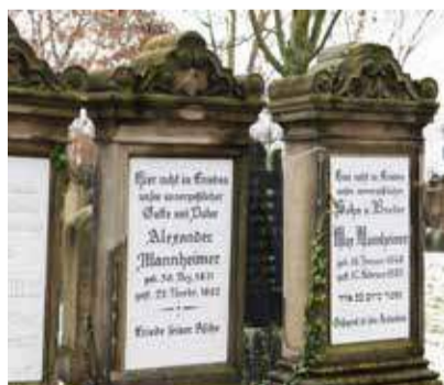
Auf dem jüdischen Friedhof in Worms liegen Angehörige von Karol Mannheimer begraben.

Dann sagt sie, dass sie dieses Bild immer vor Augen gehabt habe, als sie vor kurzem mit Lungenentzündung und Atemnot im Krankenhaus lag. Es stand sehr schlecht um sie. Dieses Foto habe ihr Kraft gegeben und ihren Lebenswillen gestärkt. Karol hat es