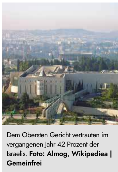
Dem Obersten Gericht vertrauten im vergangenen Jahr 42 Prozent der Israelis.

zent. Die Regierung erhält im Durchschnitt 37,5 Prozent, im vergangenen Jahr sprachen ihr aber nur 24 Prozent der Befragten ihr Vertrauen aus.