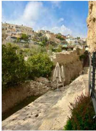
Einige Stufen des Teiches von Siloah sind bereits freigelegt und für Touristen zugänglich. Rechts befindet sich eine hohe Felswand. Nach links sollen die Ausgrabungen nun weitergehen.