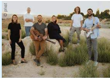
Musikalisches Highlight: Shilo Ben Hod mit Band Solu Israel