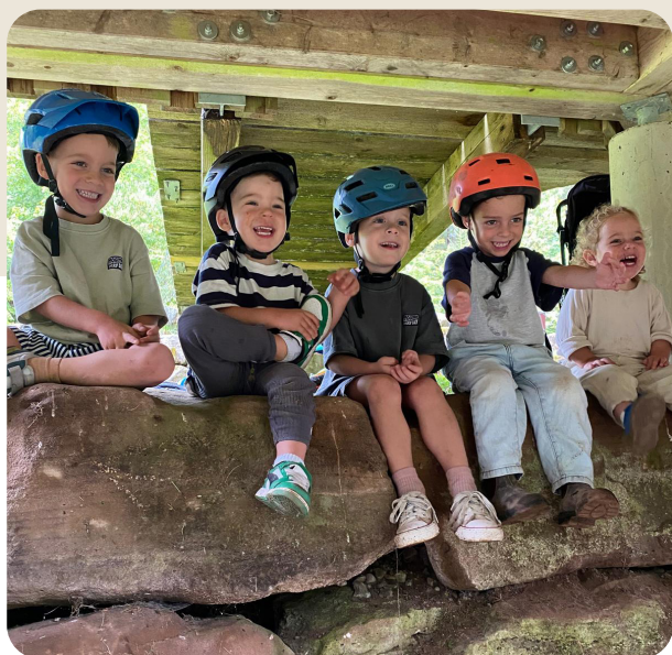
Glückliche Zeiten für die Kinder aus Kfar Aza

sie sich in der Öffentlichkeit weder als Juden noch als Israelis zu erkennen. So konnten wir ihnen einen Rahmen geben, in dem sie sich sicher fühlten.